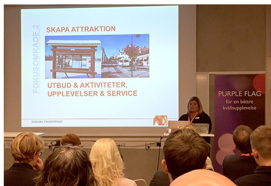
Foto: Marlene Hassel, Svenska Stadsörnor presenterar den svenska BID-modellen i Berlin.

En ansökan om att utveckla den svenska BID-modellen till en "Scandinavian BID model" är nu inskickad till Interreg-sekretariatet i Östersund och Hamar. Vi håller tummarna för att få projektet godkänt och prioriterat.