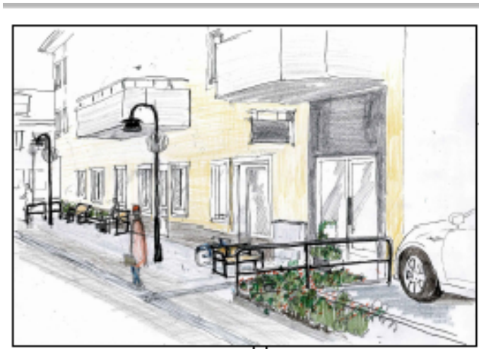
Miljöer som upplevs som tråkiga kan stärkas och förbättras med blomrabatt, förbättrat ljus och nya möbler. Skiss: Torbjörn Almroth