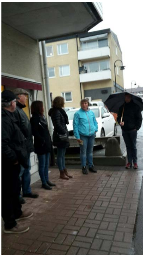
Första dialogmöte, utomhus, 20 oktober 2016.

Den 20 oktober 2016 samlades parterna (fastighetsägare, näringsidkare och Torsby kommun) till ett första dialogmöte för att analysera vad som kan göras för att gatan ska upplevas som trivsamt, tryggt och attraktivt.