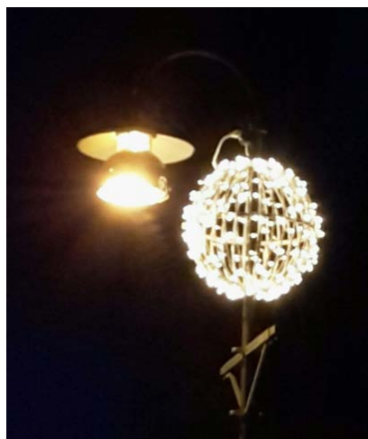
Gatlamporna på Biografgatan får samma typ av 'ljusbollar' som övriga centrum under advent/jul-tid.